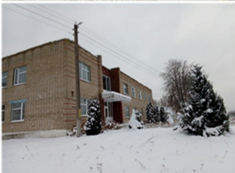
Административное здание, 234/С-5614 Ушачский район, аг. Кубличи, ул. Советская, 1 Кублический сельский исполнительный комитет Административное здание (с асфальтовым покрытием и забором): двухэтажное здание, 1975 года постройки, общей площадью 562,6 м.кв. Материал стен-кирпич, фундамент-блоки железобетонные сплошные, перегородки- кирпичные, крыша – рулонные кровельные материалы; полы – керамическая плитка, доска, окна-деревянные, двери- деревянные, отопление – центральное; канализация и водопровод – нет.