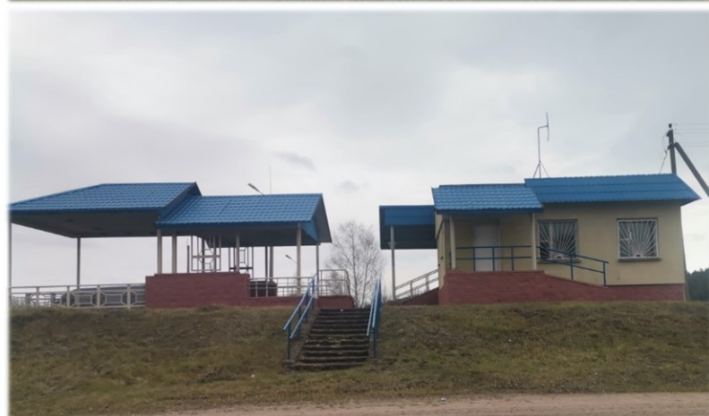
Здание шашлычной Мазоловский с/с, 31, северо-западнее д. Лужесно Мазоловский сельский исполнительный комитет Одноэтажное здание 1987 года постройки, площадью 35,2 кв.м. Водопровод, канализация, отопление электрическое, сеть электроснабжения