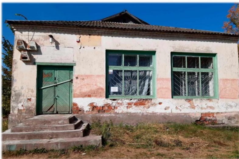
Магазин, инв. № 240/С-46470 Оршанский район, д. Софиевка, ул. Ордишевская, 33 Коммунальное унитарное консалтинговое предприятие «Оршанский региональный центр поддержки предпринимательства и недвижимости» Здание площадью 130,4 кв.м.