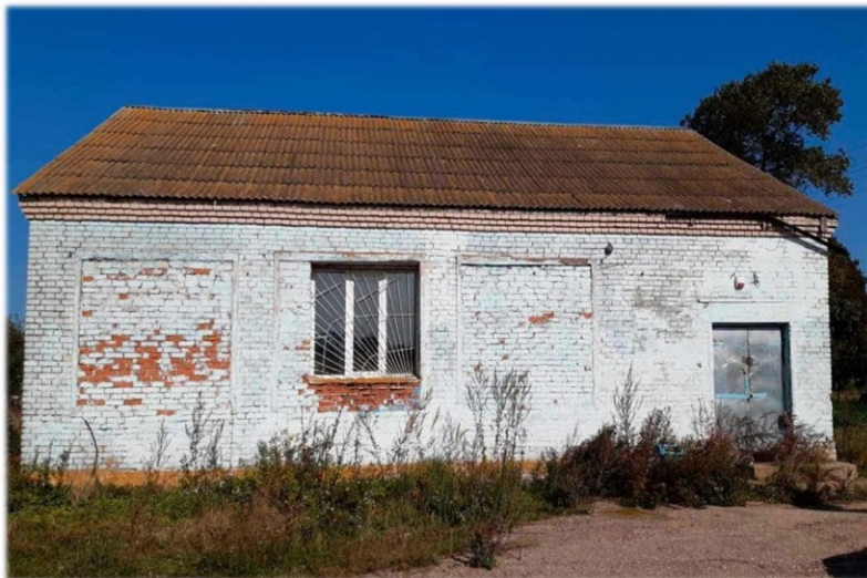
Магазин, инв. № 240/С-46214 Оршанский район, д. Новое Село, ул. Центральная, 51А Коммунальное унитарное консалтинговое предприятие «Оршанский региональный центр поддержки предпринимательства и недвижимости» Здание площадью 149,0 кв.м.