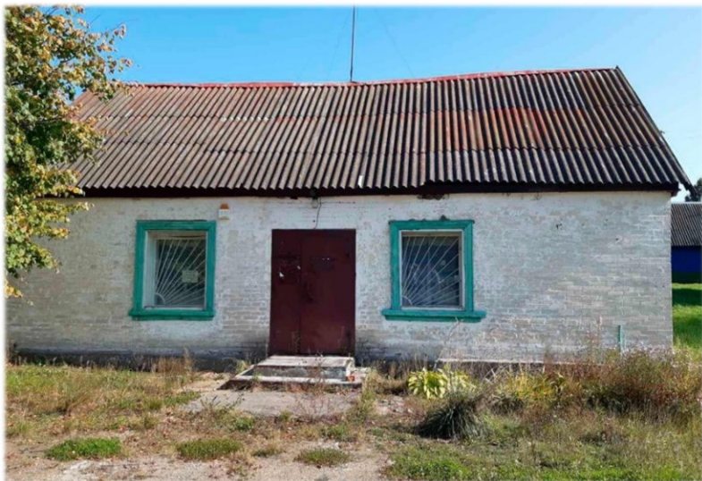
Магазин, инв. № 240/С-46422 Оршанский район, д. Клюковка, ул. Витебская, 14 Коммунальное унитарное консалтинговое предприятие «Оршанский региональный центр поддержки предпринимательства и недвижимости» Здание площадью 110,4 кв.м.