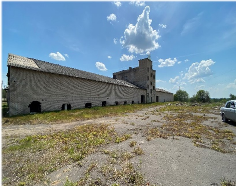
Мастерская, № 367 Ушачский район, Сорочинский сельсовет, д. Слобода Коммунальное унитарное сельскохозяйственное предприятие Витебской области «Глыбочаны» Здание одно-двухэтажное, кирпичное, общей площадью 360,0 кв. м