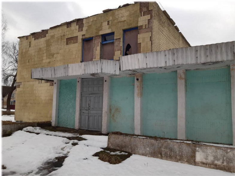
Здание конторы, инв. № 240/С-46752 Оршанский район, д. Антоновка, ул. Могилевская, 107 Коммунальное унитарное консалтинговое предприятие «Оршанский региональный центр поддержки предпринимательства и недвижимости» Здание площадью 399,3 кв.м.