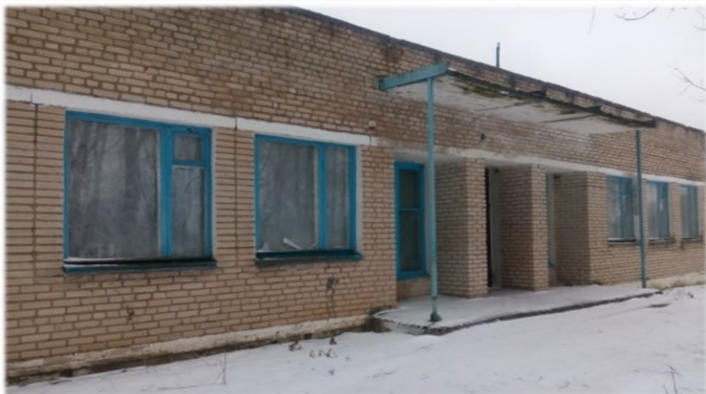
Административное здание Совета Дубровенский район, д.Клены, ул.Кленовская, 8 Зарубский сельский исполнительный комитет Капитальное строение одноэтажное, кирпичное. Земельный участок с кадастровым номером 222481703901000015, площадью 0,1527 га, сроком аренды на 50 лет. Ограничения в использовании в связи с расположением земельного участка в водоохранной зоне водного объекта (р.Лука).