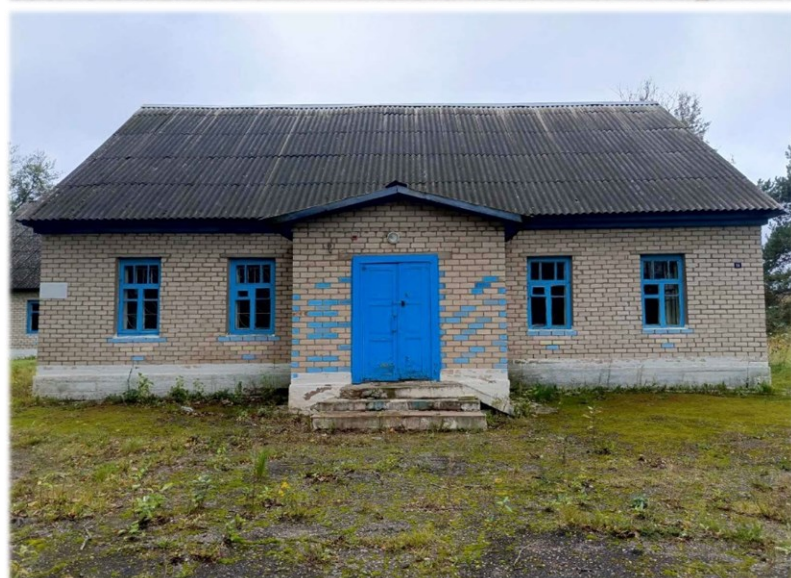
Здание Задубровского сельского клуба-библиотеки, инв.номер 200/С-61170 Задубровский с/с, аг. Задубровье, ул. Молодежная, д. 18 Сектор культуры Витебского районного исполнительного комитета Одноэтажное здание 1949 года постройки, площадью 365,5 кв.м. Водопровод, канализация, теплосеть (котел водонагревательный), сеть электроснабжения