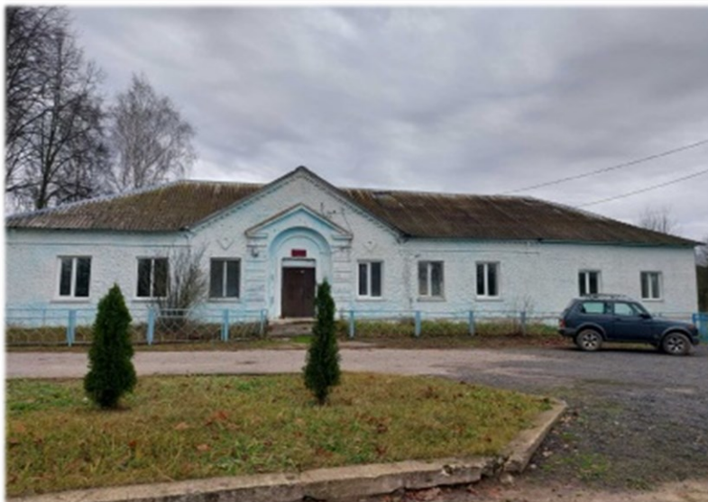
Здание конторы Дубровенский район, аг.Орловичи КУСХП «Орловичи» Дубровенского района Капитальное строение, одноэтажное, кирпичное, общая площадь, 500 кв.м.