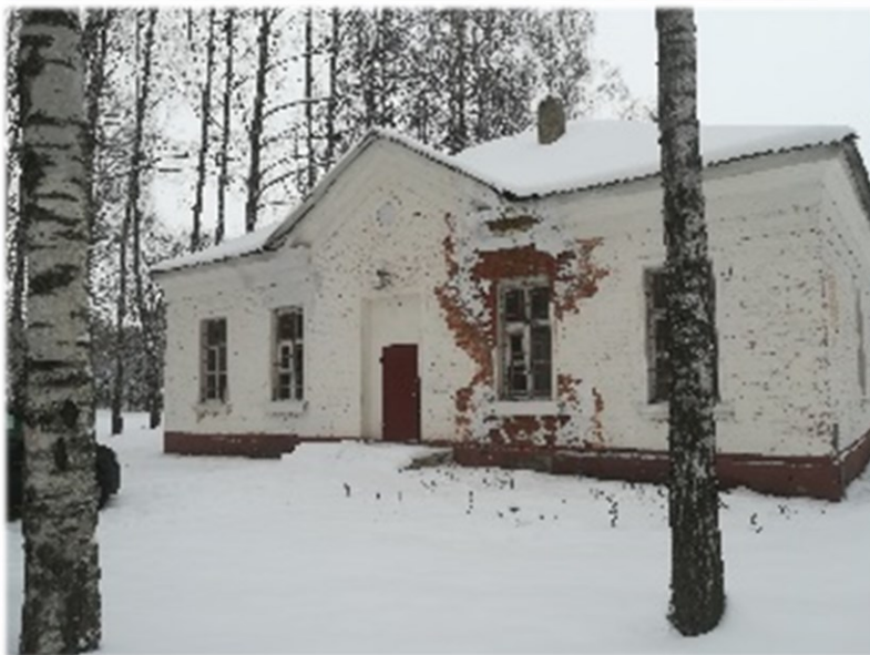
Здание АТС, инв. № 240/С-21565 Оршанский район, г.п. Болбасово, ул. Заводская, 3А Коммунальное унитарное консалтинговое предприятие «Оршанский региональный центр поддержки предпринимательства и недвижимости» Здание площадью 134,3 кв.м.