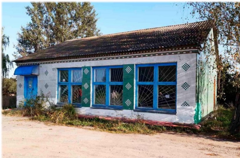
Магазин, инв. № 240/С-46166 Оршанский район, д. Туминичи, ул. Центральная, 11 Коммунальное унитарное консалтинговое предприятие «Оршанский региональный центр поддержки предпринимательства и недвижимости» Здание площадью 99,7 кв.м.