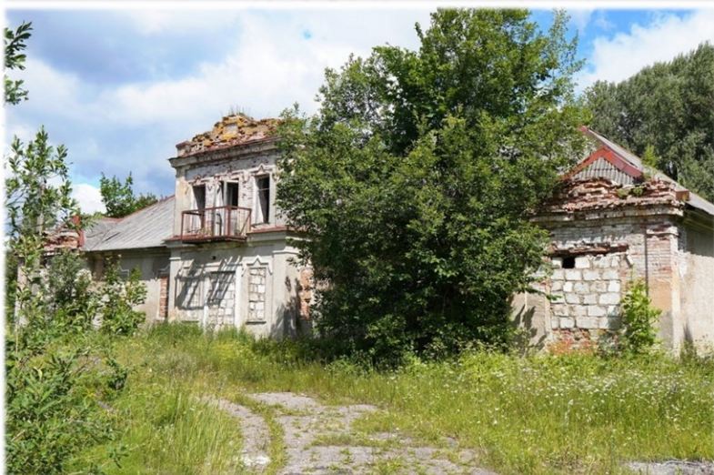
Здание бывшей конторы (историко-культурная ценность Усадебный дом XIX-XX стст.) Ушачский район, д. Новая Жизнь, 5А Коммунальное унитарное сельскохозяйственное предприятие Витебской области «Великодолецкое» Двухэтажное, кирпичное здание общей площадью 532 кв.м.