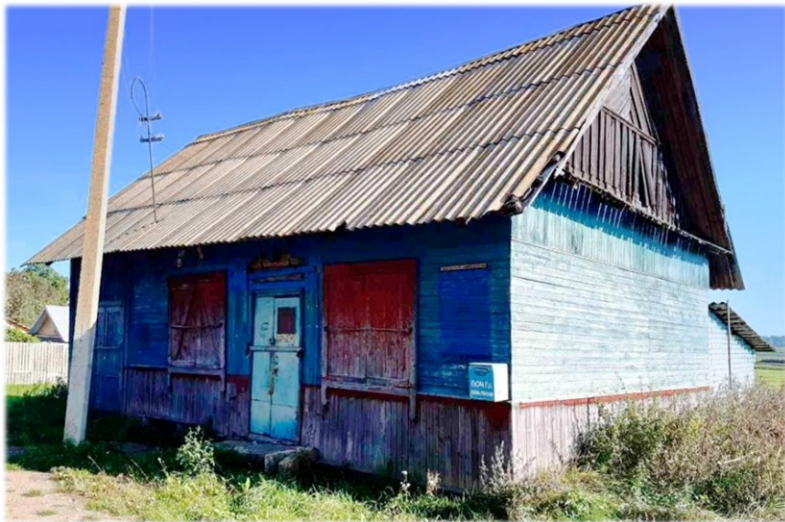
Магазин, инв. № 240/С-46215 Оршанский район, д. Ленковичи, ул. Центральная, 55А Коммунальное унитарное консалтинговое предприятие «Оршанский региональный центр поддержки предпринимательства и недвижимости» Здание площадью 91,6 кв.м.