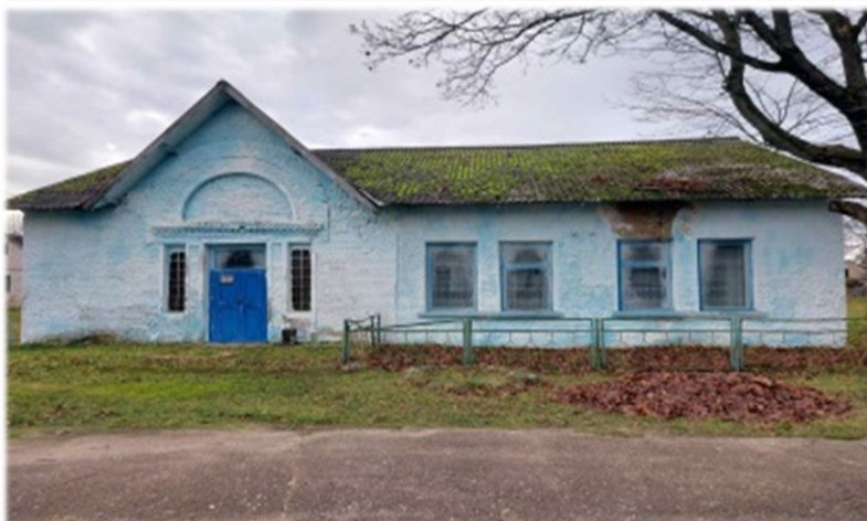
Здание столовой Дубровенский район, аг.Орловичи КУСХП «Орловичи» Дубровенского района Капитальное строение, одноэтажное, кирпичное, общая площадь 400 кв.м.