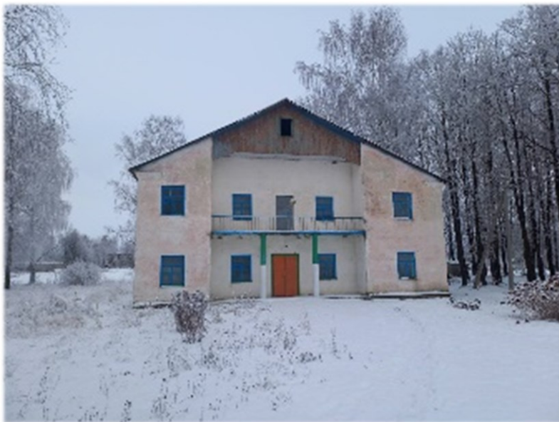
Дом культуры, инв. № 240/С-4577 Оршанский район, д. Козловичи 2-е, ул. Центральная, 4 Коммунальное унитарное консалтинговое предприятие «Оршанский региональный центр поддержки предпринимательства и недвижимости» Здание площадью 400,1 кв.м.