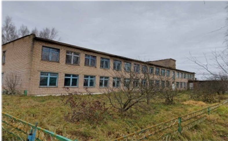
Ляднянская детский сад-школа Дубровенский район, аг.Ляды, ул.Центральная, д.30 КУСХП «Орловичи» Дубровенского района Капитальное строение, двухэтажное, кирпичное, общая площадь 1764,8 кв.м.