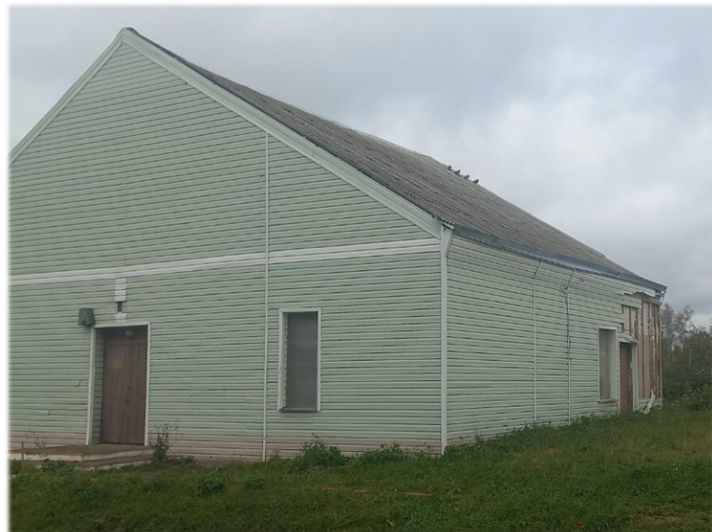
Здание кафетерия Яновичский с/с, г.п.Яновичи, ул. Унишевского, 8/1 Яновичский сельский исполнительный комитет Одноэтажное здание 1958 года постройки, площадью 120,3 кв.м. Отопление печное, сеть электроснабжения