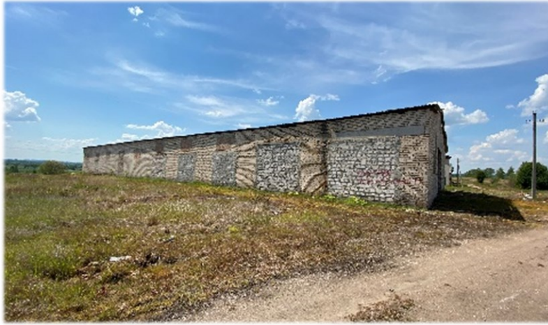
Зерносклад, № 350 Ушачский район, Сорочинский сельсовет, д. Слобода Коммунальное унитарное сельскохозяйственное предприятие Витебской области «Глыбочаны» Здание одноэтажное, кирпичное здание общей площадью 400 кв.м.