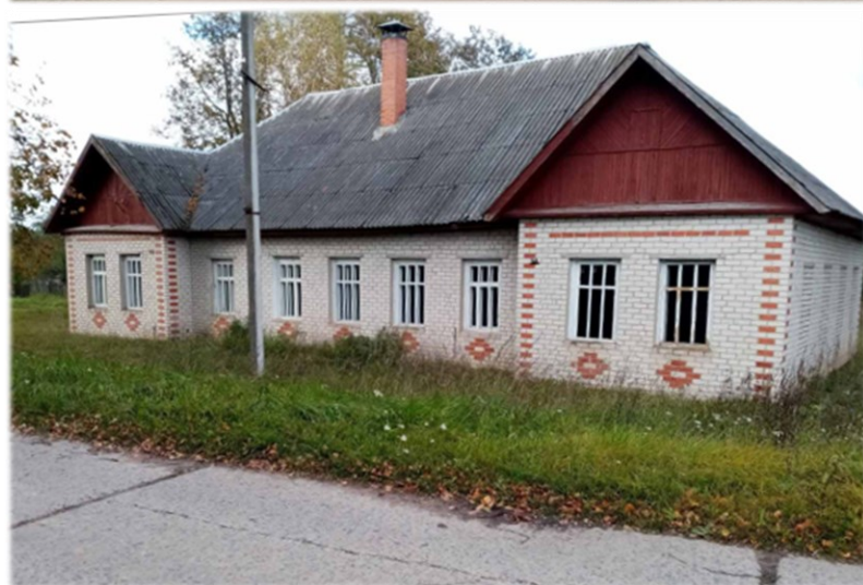
Здание сельской библиотеки-клуба, инв.номер 200/С-74021 Шапечинский с/с, д. Скрыдлево, ул. Центральная, д.1А Сектор культуры Витебского районного исполнительного комитета Одноэтажное здание 1958 года постройки, площадью 225,5 кв.м. Отопление печное, сеть электроснабжения