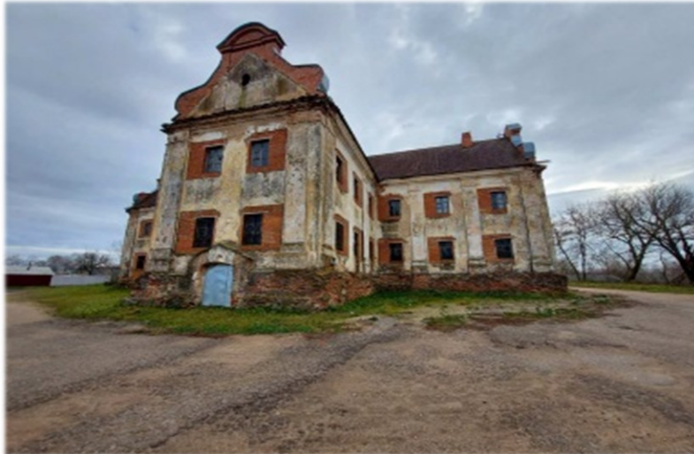
Здание бывшего монастыря Бернардинцев г.Дубровно, ул.Оршанская,11А Сектор культуры Дубровенского райисполкома Капитальное строение, двухэтажное, кирпичное, является объектом ИКЦ, общая площадь 386,16