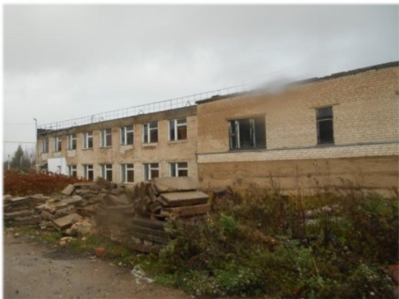
Здание столовой, инв. № 240/С-42956 Оршанский район, г.п. Ореховск, ул. БелГРЭС, 39 Коммунальное унитарное консалтинговое предприятие «Оршанский региональный центр поддержки предпринимательства и недвижимости» Здание площадью 1011,0 кв.м.