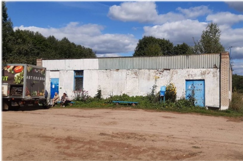
Магазин, инв. № 240/С-44938 Оршанский район, д. Браздетчино, ул. Родниковая, 175 Коммунальное унитарное консалтинговое предприятие «Оршанский региональный центр поддержки предпринимательства и недвижимости» Здание площадью 281,8 кв.м.